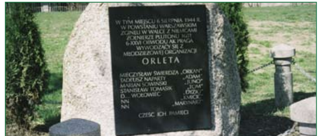
An dieser Stelle wurden während des Warschauer Aufstands Soldaten der Jugendorganisation „Orleta“ der Heimatarmee getötet. (Es folgen die Namen)

Praga. Die Sowjets riefen zu einem Aufstand in der Hauptstadt auf. Nachdem dieser ausgebrochen war, eroberte die Rote Armee nach kurzen Gefechten den Bezirk auf dem Rechten Weichselufer und ... die Offensive kam zum Stillstand. Vergebens warteten die jenseits des Flusses kämpfenden Aufständischen auf Hilfe. Anfang Oktober kapitulierte die Heimatarmee, und kurz darauf wurde Linksufer-Warschau von den Sondereinheiten der SS Straßenzug um Straßenzug zerstört.